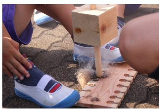
▲まいぎりを使っでの火おこし風景(福井国体)